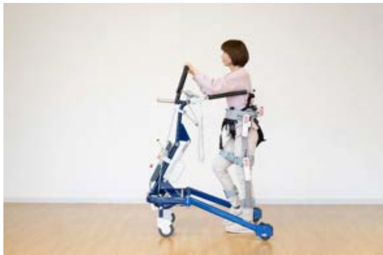
curara®・POPO・ハーネスライトを併用した様子